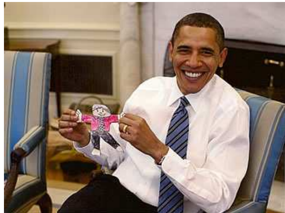
大人気のフラットスタンレーと アメリカのオバマ大統領